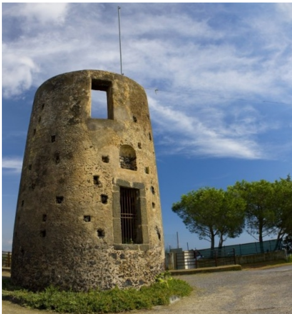
Figura 1 – Forte Mulino a Vento